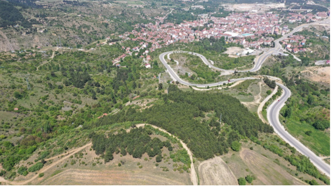
Resim 2: Söğüt Şehri ve Proje Alanı